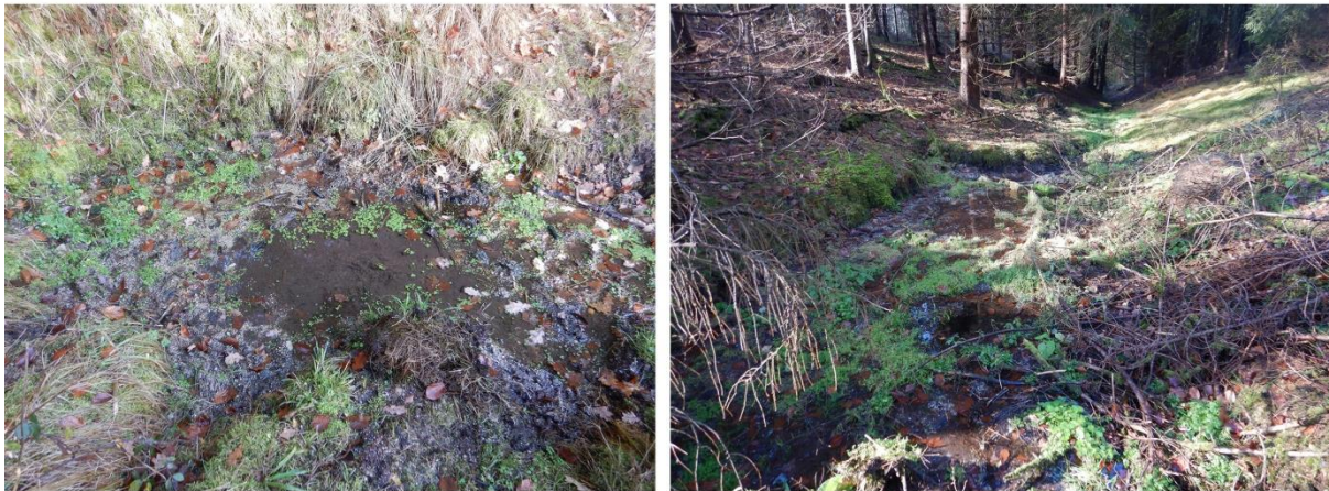
Abbildung 2: Kartierte Wasseraustritte Nr. 2 (links) und Nr. 3 (rechts)